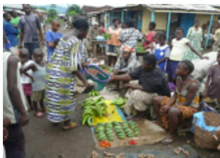
Bananenverkauf am Markt