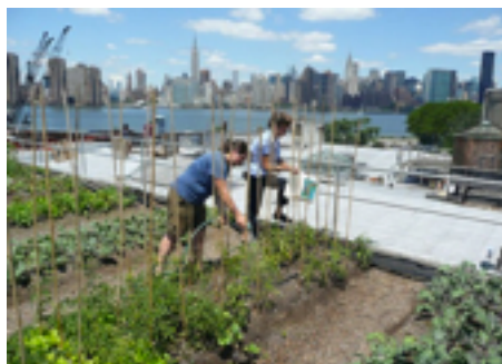
USA City Gardening