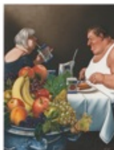
Cartoon: G. Haderer