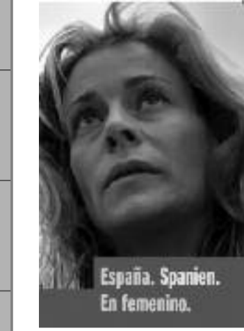
España. Spanien. En femenino.

Diese Broschüren liegen für Sie kostenlos im Kinofoyer auf!