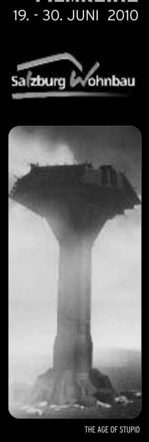
THE AGE OF STUPID

Bis zum Jahr 2000 war in Kalifornien eine ganze Flotte von Elektro-Autos unterwegs. Die meisten Besitzer - unter ihnen Tom Hanks und Mel Gibson - lobten ihre EV- und lobten ihre exzellenten Fahreigenschaften. Doch die Tage der umweltfreundlichen Viereräder waren bald gezählt. Die ungläublichen Hintergründe des Verschwindens der schönen Flitzer deckt diese Dokumentation auf: spannend wie ein Krimi - und gefährlich aktuell.